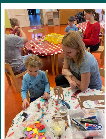
Dílny s rodiči