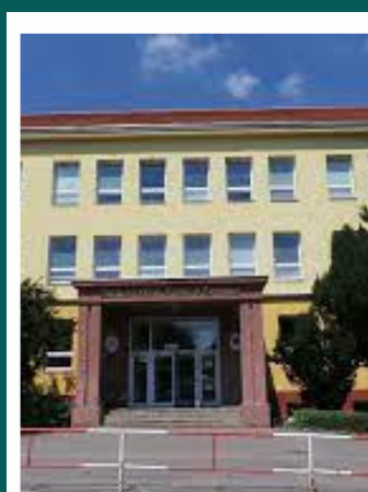
ZŠ A. Čermáka