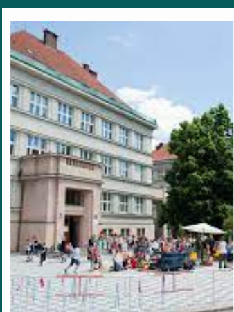
ZŠ nám. Svobody

Naše mateřská škola klade velký důraz na spolupráci s partnery. Rozvíjíme spolupráci s místními školami, charitativními organizacemi a dalšími subjekty. Tato spolupráce nám umožňuje nabídnout dětem bohatší vzdělávací program, podporovat jejich individuální potřeby a vytvořit pro ně bezpečné a stimulační prostředí.