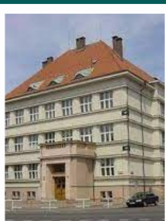
ZŠ Emy Destinnové