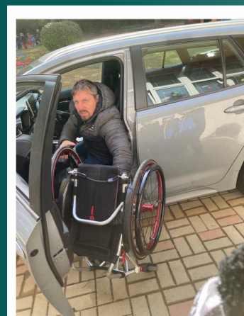
Kamarádi na vozíku