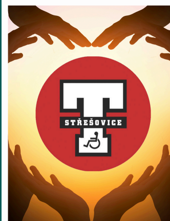
Srdci vozík nevadí