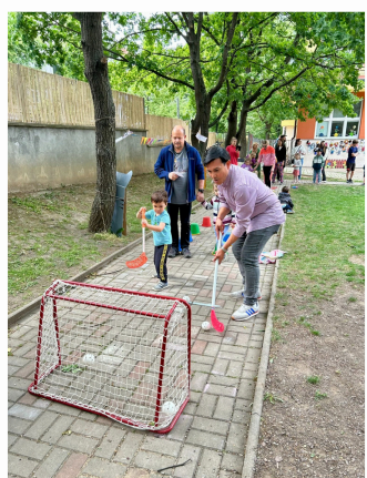
Sportování s rodiči