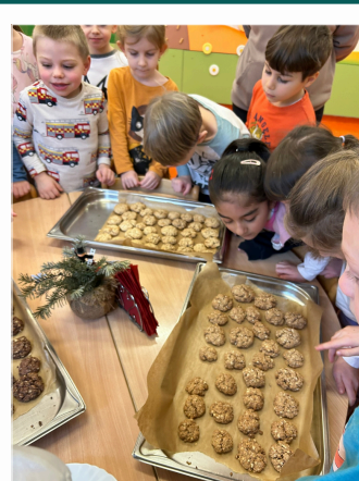
S nutriční terapeutkou